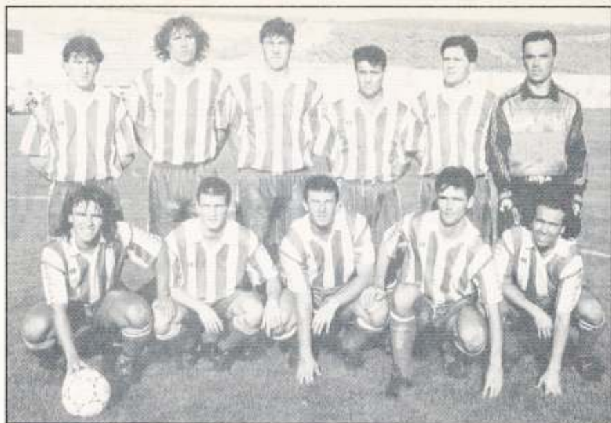
FORMACION HABITUAL DEL ALGECIRAS

En las dos últimas temporadas al Algeciras parecía como si la solera que antaño cosechó fuese lo único que le iba quedando.