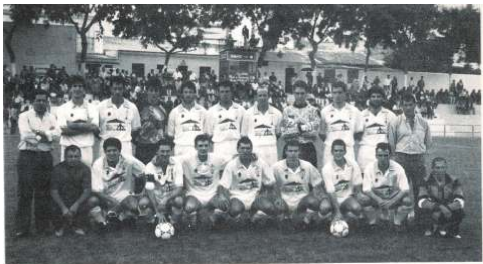
LEBRIJA ACTUAL TEMPORADA

Al Lebrija de la actual campaña le está saliendo todo redondo. Una temporada que de momento puede parecer de cara al futuro irrepetible. Los problemas económicos resueltos hasta la fecha gracias a las ayudas municipales. La trayectoria deportiva, de lo mejor.