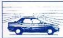
Nuevo coeficiente aerodinámico de 0,33.