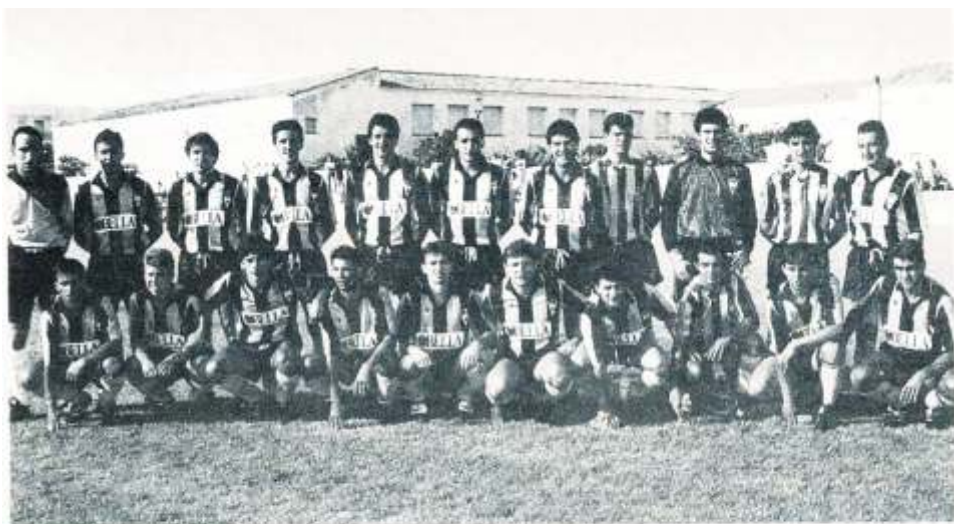
SAN ROQUE C.D. TEMPORADA 91/92

Segunda temporada consecutiva en la que el cuadro lepero parte entre los favoritos para la disputa de la fase de ascenso a Segunda división "B". Esta es la única meta propuesta. El objetivo, el ascenso.