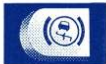
Sistema ABS electrónico en opción.