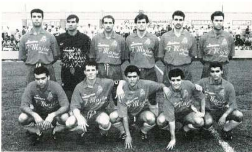
FORMACION HABITUAL DE LOS PALACIOS EN LA ACTUAL LIGA

Los Palacios ha sabido reunir una plantilla para competir con los favoritos del grupo en su debut en Tercera división.