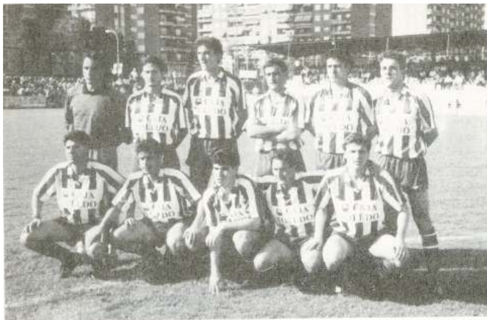
EN LA FOTO EL EQUIPO DEL TALAVERA QUE SE ENFRENTÓ AL ECÍJA

DÍAZ-PABLO: "Siempre dije que el ascenso era cosa del Ecija y del Talavera"