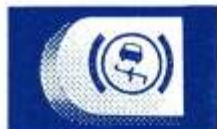
Sistema ABS electrónico en opción.