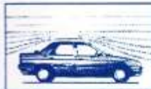
Nuevo coeficiente aerodinámico de 0,33.