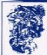
Motor CVH de 90 a 108 CV.