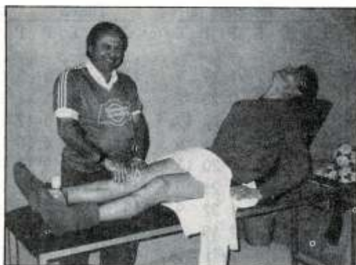
No volverá a sufrir León esta temporada por el fútbol

El pasado día seis, el lateral León daba la noticia. Sus vínculos con el Ecija Bpié. terminaban. Ofertas de trabajo distintas al fútbol le llenaban más que este deporte. Su idea era exponerlo al club el próximo mes, pero ante los condicionantes que envolvían el tema Ruda, optó por adelantar