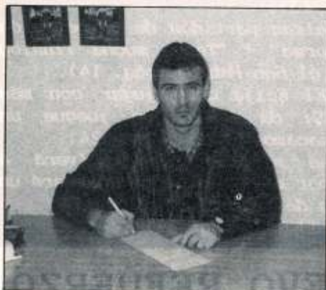
RUDA firmando por el Ecija

- Llegar al Ecija como refuerzo y en un supuesto tener que marcharte antes de jugar el play-off sería un problema para el club.