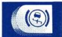
Sistema ABS electrónico en opción.