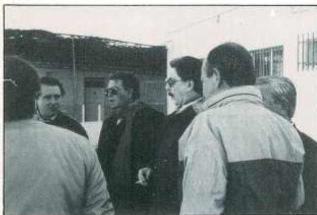
Presidente y directivos del Ecija.