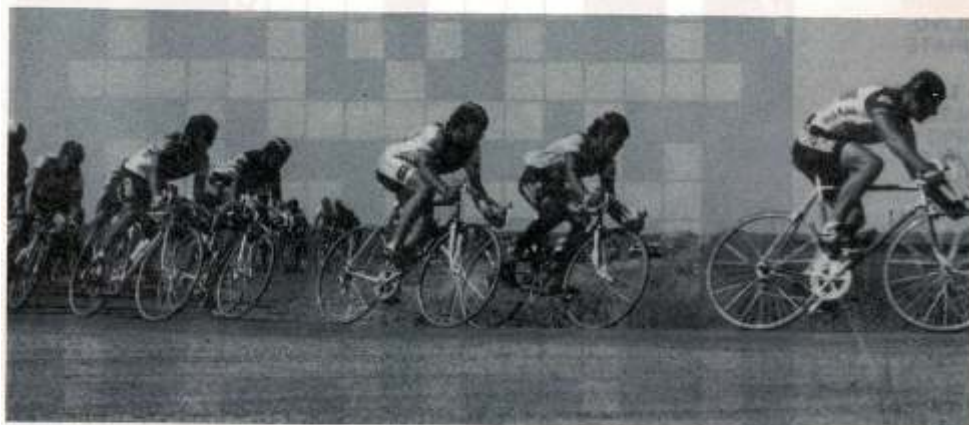
Comenzando la subida a Palomarejo (camino vecinal)

Meta Volante en Fuentes de Andalucía y premios que oscilan entre las 20.000 pts. para el primero hasta el 50º, adornados de varios trofeos a los mejores clasificados de la general y locales.