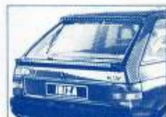
NUEVA AERODINAMICA SX.