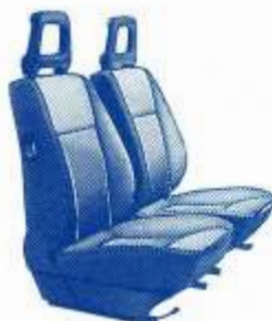
ASIENTOS ANATOMICOS SX.