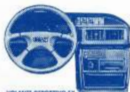
VOLANTE DEPORTIVO SX.