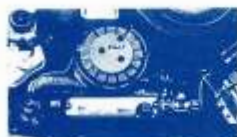
MOTOR SYSTEM PORSCHE. HASTA 90 CV.